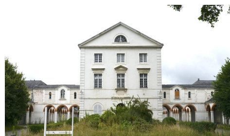
Dessin du projet Novaxud par Claude Vasconi (1), bâtiment construit en phase 1 (2), plan de situation (3), hôpital classé Etoc Demazy à réhabiliter (4)